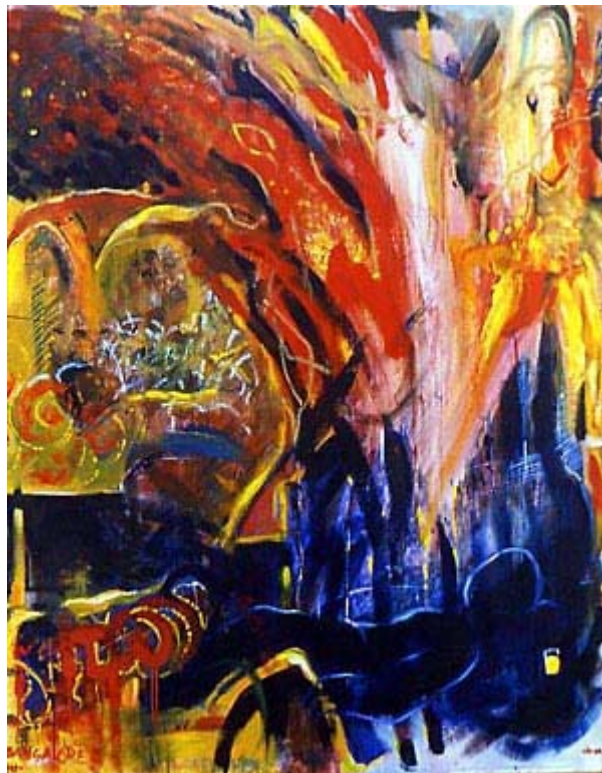
Jo Møller / Erindring: "Bangalore - Den Gule Drik". 135 x 115 cm. Olie på lærred. 1991

Indien er paradoksernes land og skønheden blander sig med rædslerne. Stærke smukke farver blandes med gråt i gråt. Sukkerrør, mango og søde bananer med fræsende stærk karry og forurenset vand. En dybtliggende viden om verdens storhed, gru og skønhed, kulturelle mangfoldighed og foranderlighed blev plantet i mig. Denne vished gjorde mig til en fremmed i det lille land jeg vendte hjem til i 1954.