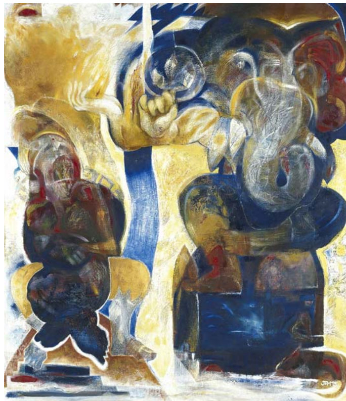
Jo Møller/God of Art.[116 x 100] Akryl og olie på lærred. 1995