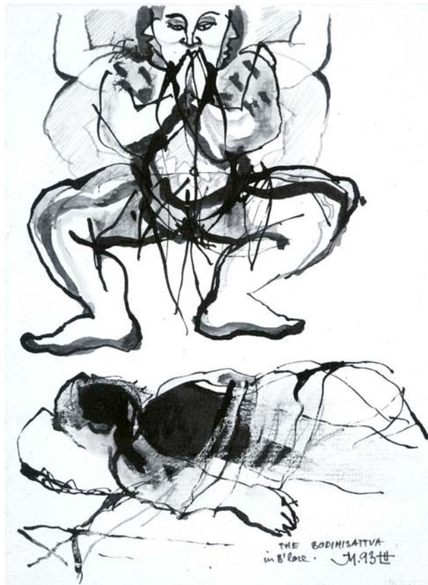
Jo Møller / Erindring: "The Bodihisattva"

Drømmen handler om et fænomen, som forekommer helt naturligt i Indien. Det gør det til gengæld ikke i vores kultur, hvor det er tabu: sjæleombytning.