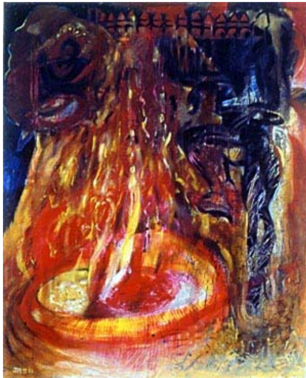
Jo Møller / Tiruvannamalai. 123 x 100 Akryl og olie på lærred. 1993

Rejsen fortsatte nu til Tiru'kollur , hvorfra jeg besøgte Tiruvannamalai , tempelbyen ved det Hellige Bjerg, opført til ære for Shiva's 2. reinkarnation. En magtfuld repræsentant for det hinduistiske Indien. Her kom jeg ind i det allerhelligste. Det var en meget indtrængende oplevelse, som dannede klangbund, for det mest gennemgående motiv i mine senere Indiens-billeder. Med titler som "Tiruvannamalai" og "Shivas Dance".