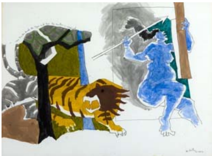
M. F. Hussain. Untitled | Watercolour on Paper | 29" x 39" | 1983