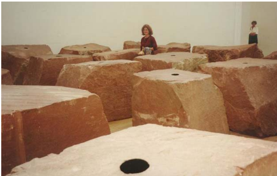
Anish Kapoor. Void Field. Sandstone & Pigment. Dimensions variable. Biennalen i Venedig 1990.

De Indiske kunstnere har egentlig ikke interesseret mig mere end andre kunstnere. Jeg så primært nogle af verdens bedste kopister, som videreførte traditionen. I det omfang indiske kunstnere kan bygge på deres egen kultur / tradition og transformere den i deres samtids udtryk, som f.eks. Bhupen Khakhar , som var på Dokumenta i 1992 og især Anish Kapoor , som jeg var så heldig at opleve på Biennalen i Venedig i 1990, - ja så rykker det!