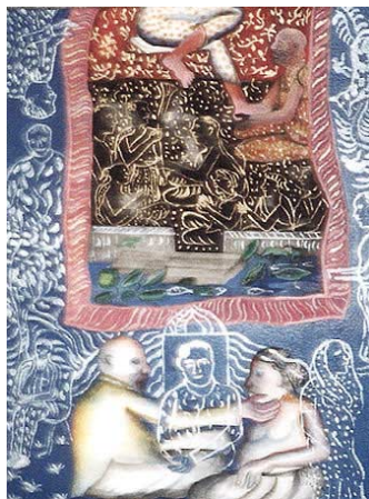
Bhupen Khakhar/Seva/ water colour on paper (19 x 14) 2002